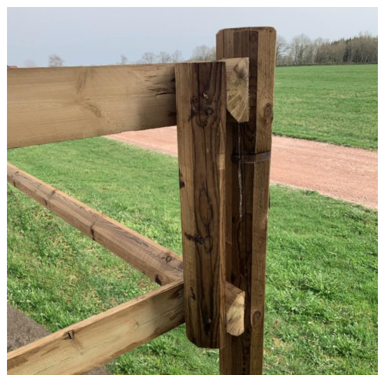
Abbildung 1: Eckmontage von Querstangen, die auf der Innenseite der Koppel angebracht werden.

Jede Querstange ergibt eine Einzäunung von 2750 mm Länge. Sie erhalten einen Pfosten und zwei Querstangen zusätzlich.