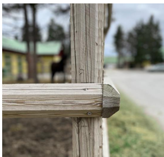
Abbildung 2: Eckmontage von Querstangen, die auf der Außenseite der Koppel angebracht werden.